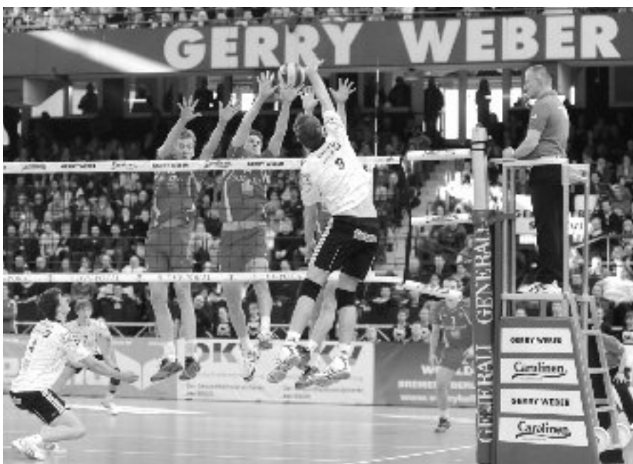
Wie in 2011 ermitteln auch am 4. März 2012 die beiden Top-Klubs von Generali Haching (hi.) und VfB Friedrichshafen den DVV-Pokalsieger.

Ab 15.30 Uhr steigt das Finale der Männer zwischen Generali Haching, Pokalsieger der letzten drei Jahre, und dem Deutschen Meister VfB Friedrichshafen. Schwerin hat mit dem Sieg gegen