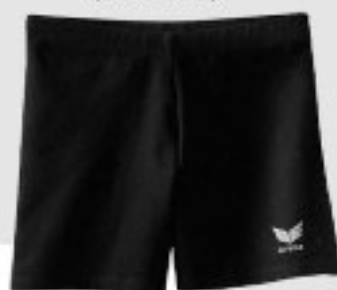
Erima Verona Tight (ER1168)

Tight verfügbar in den Farben skyblau und navy in den Größen 34 - 48.