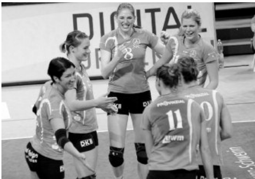
Schwerin jubelt über den Finaleinzug.

Wiesbaden die Chance, eine stolze Serie fortsetzen. Der Deutsche Meister der Saison 2010/2011 hat in den letzten zehn Jahren fünf Halbfinals erlebt und wenn es einen Sieg gab, dann wurde auch das Endspiel gewonnen wie 2006 und 2007. Nun ist das halbe Dutzend voll und natürlich träumt das Team von Trainer Teun Buijs von einer erneuten Jubelfeier vor der stets begeisternden Kulisse im GERRY WEBER STADION. Vilsbiburg hat seit 2002 sechs Mal in der Runde der besten Vier gestanden, kam aber nur einmal siegreich durch. Das war 2009 und nach dem 3:2 im Endspiel gegen Dresden durften die Niederbayern auch den Pokal in die Höhe stemmen. In der Bundesliga führen die Niederbayern die Tabelle mit 20:4 Punkten an, obwohl sie zuletzt die ersten beiden Saisonniederlagen kassierten mussten. Schwerin liegt auf Platz vier mit 16:6 Zählern.