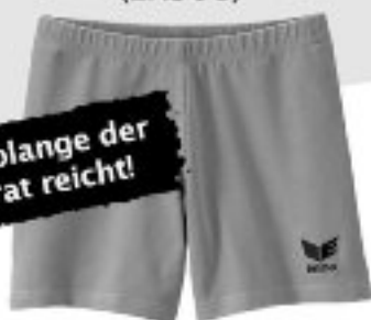
Erima Verona Tight Modell 2009/2010 (ER306)