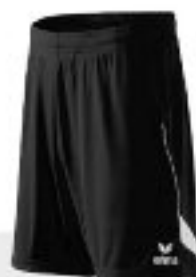
Erima Short Alpha Line (ER134)

Tight verfügbar in den Farben schwarz, royal und rot in den Größen 34 - 48.